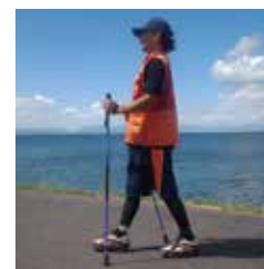
ディフェンシブスタイル