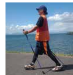
アグレッシブスタイル